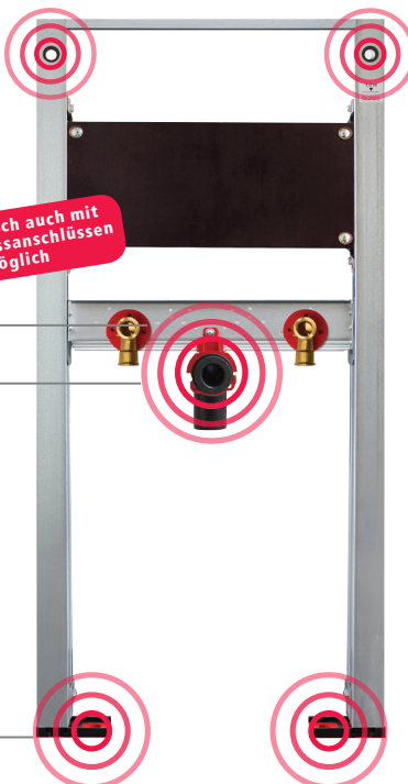
BS+ WT-Montageeinheit Art.-Nr. 212 005.00 ohne Anschlüsse Art.-Nr. 212 005.99

auf Wunsch auch mit Fremdpressanschlüssen möglich