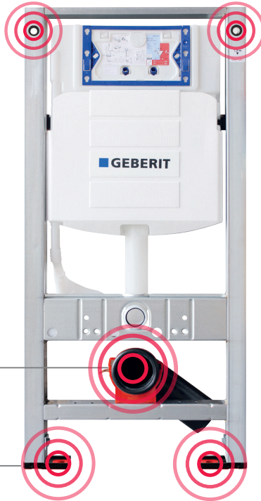
BS+ WC-Montageeinheit mit Geberit UP SPK Sigma Art.-Nr. 211088.00

Schallentkoppelte, herausziehbare Kunststofffüße