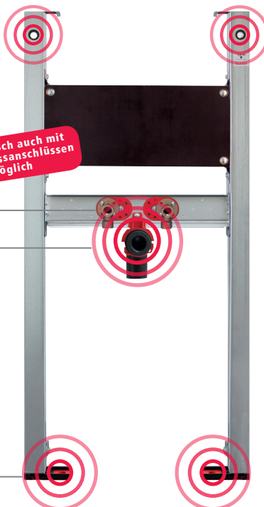
BS+ WT-Montageeinheit Art.-Nr. 212 005.00 ohne Anschlüsse Art.-Nr. 212 005.99

auf Wunsch auch mit Fremdpressanschlüssen möglich