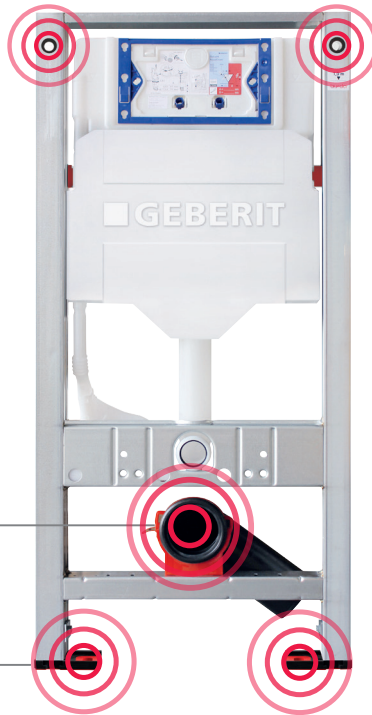
BS+ WC-Montageeinheit mit Geberit UP SPK Sigma Art.-Nr. 211088.01

Schallentkoppelte, herausziehbare Kunststofffüße