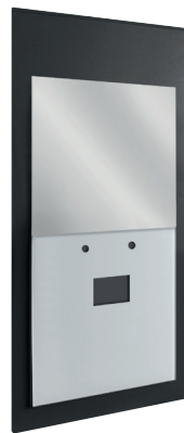
Ansicht mit integriertem Spiegel

Burda my move WT comfort Abmessungen: B / H / T: 600 / 1120 / 170 mm Art.-Nr.: 270501 Abmessungen: B / H / T: 600 / 1265 / 170 mm Art.-Nr.: 270502