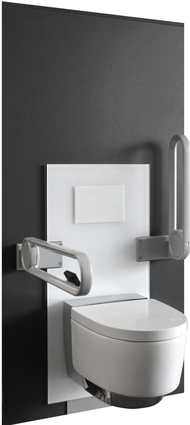
Burda my move WC care Abmessungen: B/H/T: 640/1265/200 mm Art.-Nr.: 270002